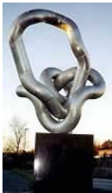
Harald Bodøgaard: Vekst (2001)

Nilsson-gruppen, Bodø 270 x 250 x 220 cm Syrefast stål